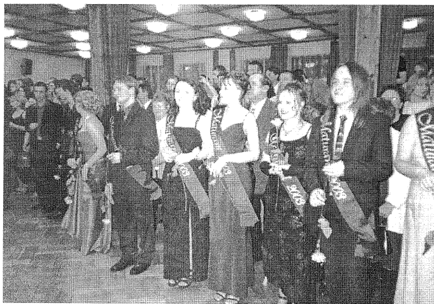
V pátek 14. února se v kulturním domě v Králíkách konal 116. maturitní ples Gymnázia v Novém Bydžově. Podrobnosti z této společenské akce, jak je zachytila studentka maturitního ročníku Kateřina Chvojková ze IV.A., najdete na internetových stránkách: www.novybydzov.cz .