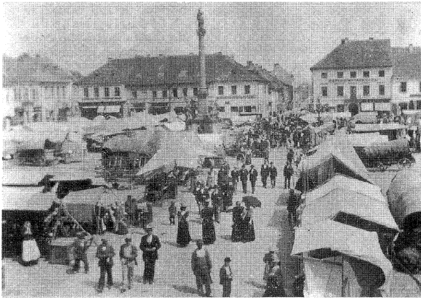
Jeden z řady unikátních snímků pořízených koncem 19. století magistrem farmacie Viktorom Benešem zachycuje čilý ruch na novobydžovském náměstí o jarmarku. Soubor Benešových fotografií můžete vidět na výstavě BYDŽOV ZNÁMÝ A NEZNÁMÝ v našem muzeu.