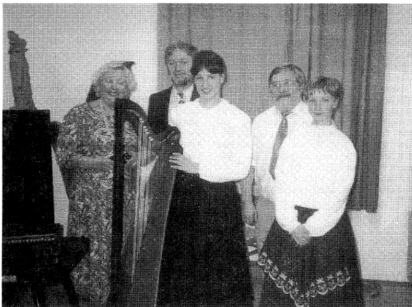
Účinkující a pořadatelé