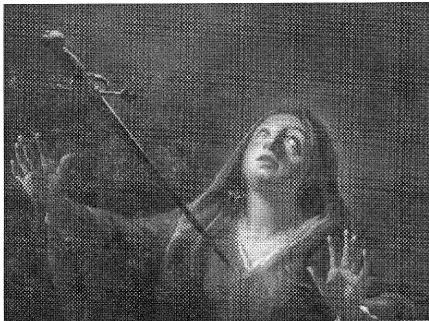
Petr Brandl — Matka Bolestná (1733), olej na plátně, detail