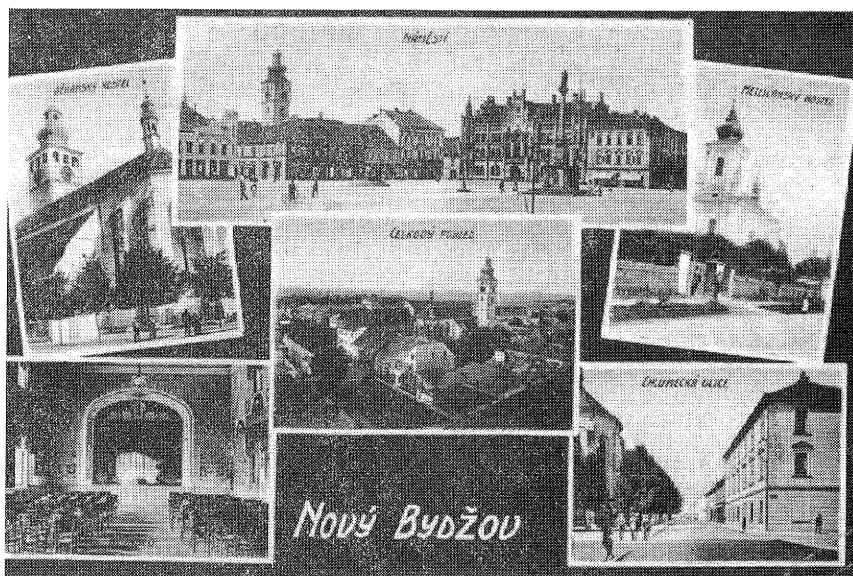
Barevná pohlednice Nového Bydžova — montáž šesti snímků z r. 1915 — vlevo dole interiér divadelního sálu hostince Na Kopečku před přestavbou.