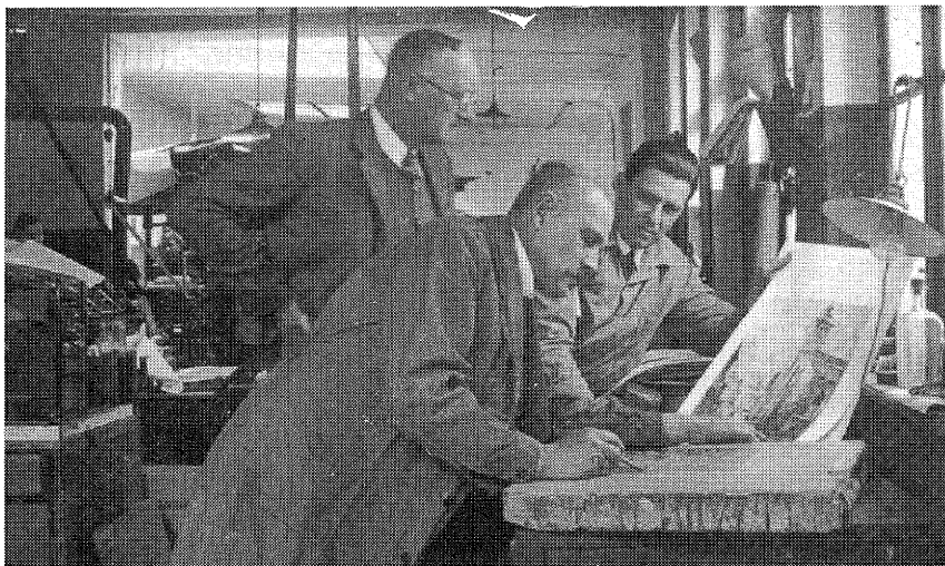
Vzácný snímek z Janatovy tiskárny v roce 1937