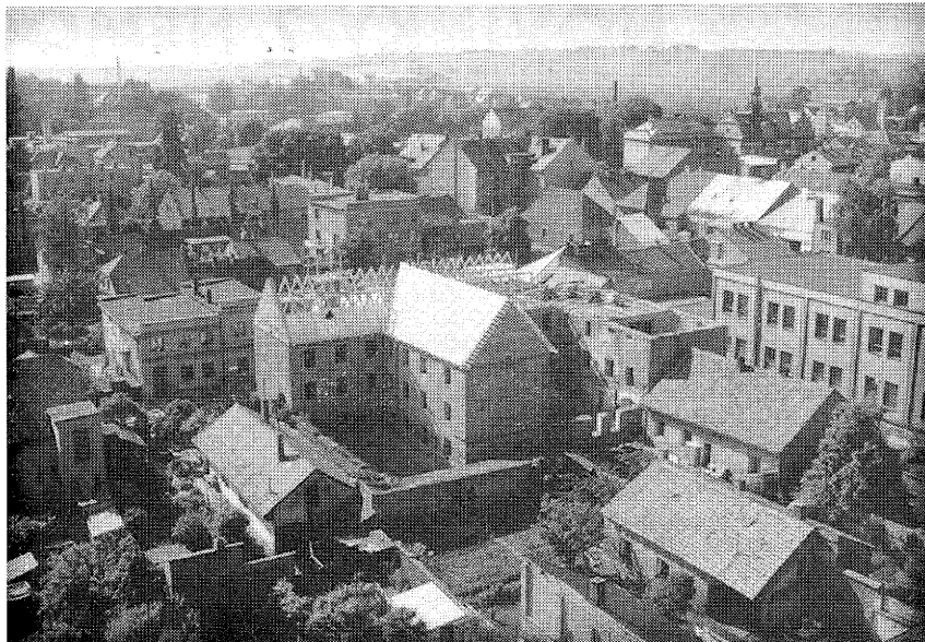
Netradiční pohled na přestavbu bývalé staré soudní budovy na dům o 17 bytů, prováděnou firmou J. Chlad - Kosičky

Původně se mělo hlasovat o zrušení městské policie a převedení pultu CO na soukromou bezpečnostní agenturu současně, ale na návrh J. Prokopa se hlasovalo odděleně. Pro zrušení pultu CO u městské policie a jeho odprodej soukromé bezpečnostní agentuře se vyslovilo 17 členů zastupitelstva, 2 byli proti a 2 se zdrželi hlasování. Pro zrušení stávající městské policie v Novém Bydžově ke dni 31. července