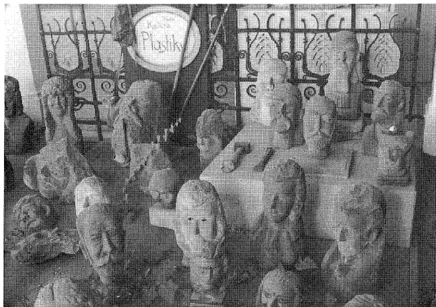
Z expozice V. Kudery - Křapíka v novobydžovském muzeu