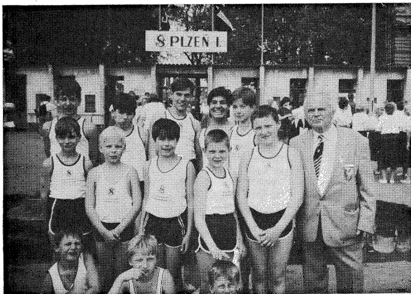
Žáci Sokola Nový Bydžov před branou stadiónu ve Štruncových sadech v Plzni