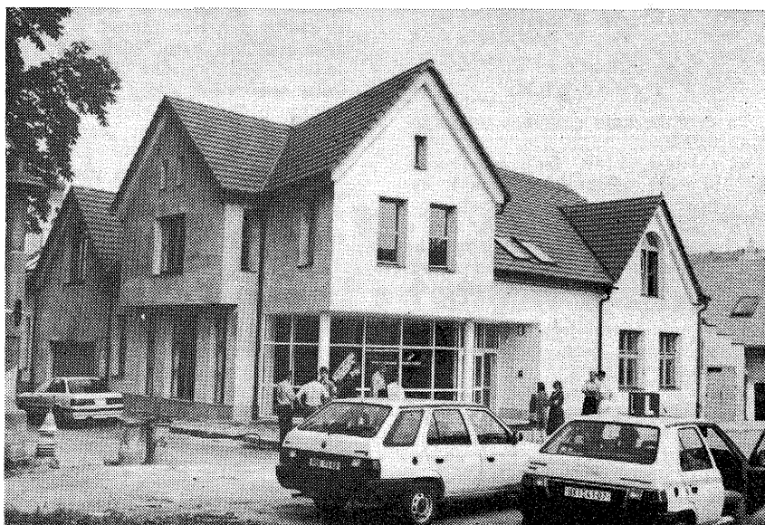
Autoškola Louda zahájila provoz v nové budově 1. července 1995

Další služby: prodej autodoplňků ŠKODA garanční servis, měření emisí