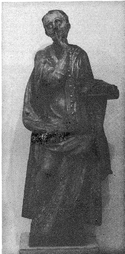
Sv. Jan Sarkander