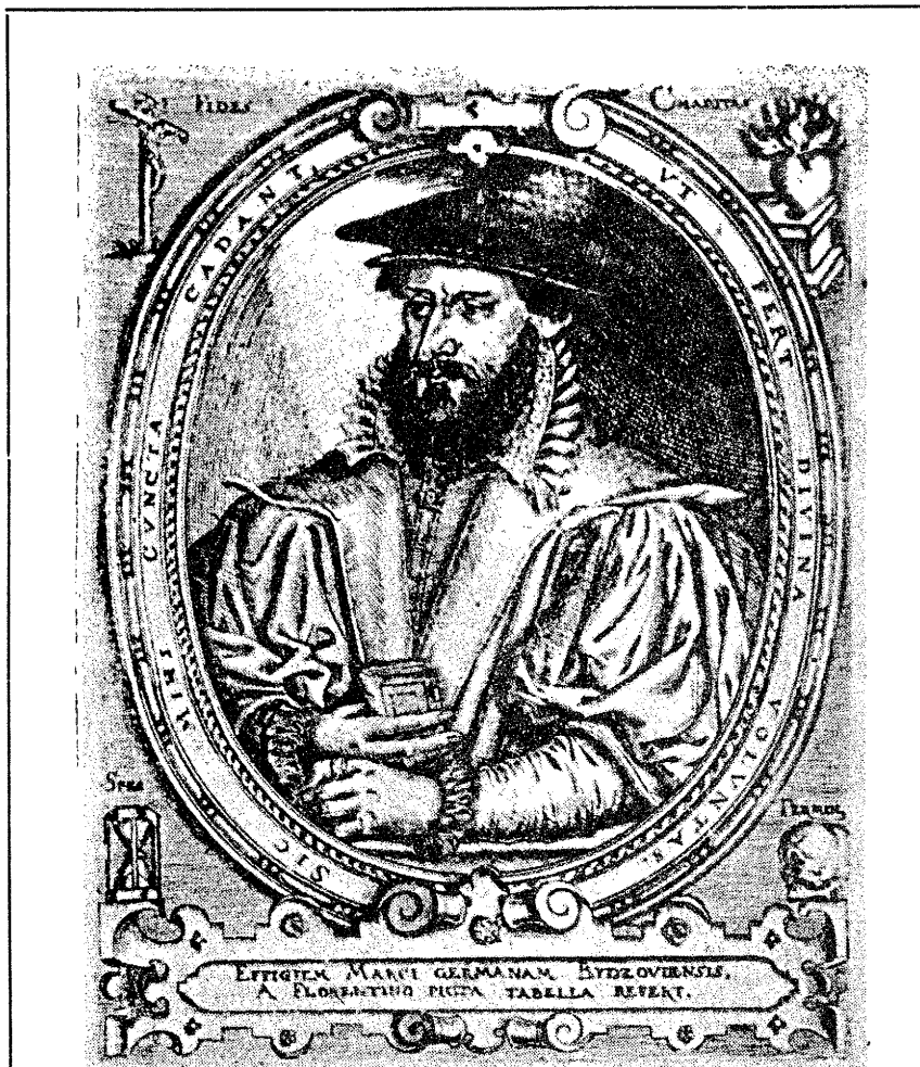
Při příležitosti 425. výročí výkupu Nového Bydžova z poddanství dnes přinášíme reprodukcí rytiny Marka Moravce Bydžovského z Florentina (1540 — 1612), našeho velkého rodáka, který se nejvíce zasloužil o výkup z poddanství a svobodnější život měšťanů v královském věnném městě.