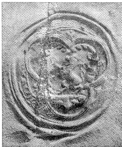
Soudobá přitřístěná pečeť města Nového Bydžova

Poslední stanicí bude samota... Po koberci teskníc půjdeme spolu do komnaty předků, tak tiché, přetiché, abychom si u jejich velebnosti padly do náručí, tiše vzlykajíce. Po proslapaných kobercích života půjdeme spolu do komnaty předků k jejich sluncem vybledlým portrétům, ale i přes nános prachu je všechny poznám, i moje samota je pozná a zaraďuje se se mnou. Víím to, že všichni na mne pohlédnou ne prázdnýma očima odevzdanýma životu, ale velikýma očima lásky, všudypřítomné a všeodpouštějící jako země, z níž jsme vyšli a která si nás žádá. Vždycky si nás žádá pro svoji velikost od věků do věků. I ona už po mně vztahuje ruce, které mi až teď občas klade na rameno. Ale obě vííme, ještě ne — ještě musím počkat na samotu čekající na mne na poslední stanicí. Možná, že se tak bude podobat novobydžovskému nádraží s truhlíky květin, čekající a přešlapující na jeho peroně, aby mě už nikdy neopustila, samota, má poslední družka, a abychom spolu vstoupily do komnaty předků tichými kroky, s tichými, ale neutichlými srdci, která dokavad buší, všichni moji předkové žijí a jejich komnata ožije jejich dechem, jejich myšlenkami, jejich hlasy a vespolu si řekneme, že tisíckrát stálo za to sejít se kdysi dávno či právě teď, kdy mě líbá samota, poslední upřímná přítelkyně života, a radostně jí zehním.