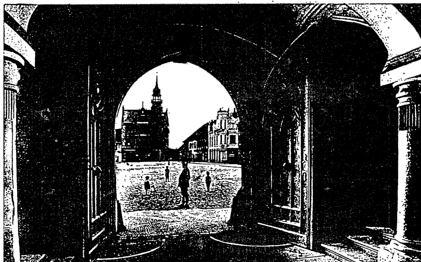
Nový Bydžov. Partie z vestibulu radničního.