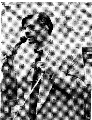
Herec J. Bartoška na předvolebním shromáždění koalice ODS a KDS v našem městě

Práce na přípravě a zabezpečení voleb byly započaty již v měsíci březnu zpracováním seznamů voličů a jejich aktualizací. V termínu do 30. 4. 1992 jmenoval starosta zapisovatele okrskových volebních komisí z řad pracovníků aparátu. Rada stanovila volební okrsky a volební místnosti, nejnižší počet členů okrskových volebních komisí. Na návrh jednotlivých politických stran a hnutí byly vytvořeny okrskové volební komise. Jejich první zasedání včetně zapisovatelů svolal starosta na den 5. 5. 1992, kdy všichni členové i zapisovatelé složili do jeho