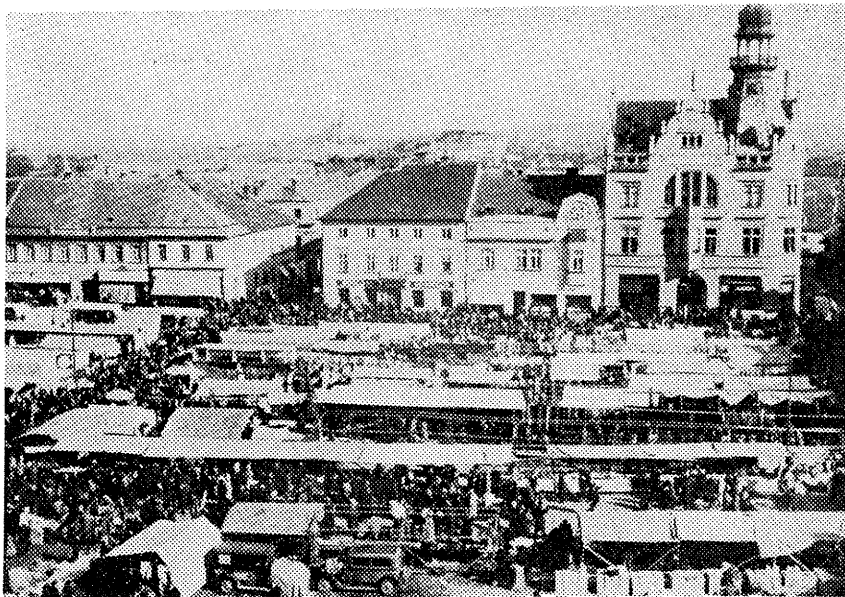
Náměstí o jarmarku v květnu 1935 Fotoarchív muzea