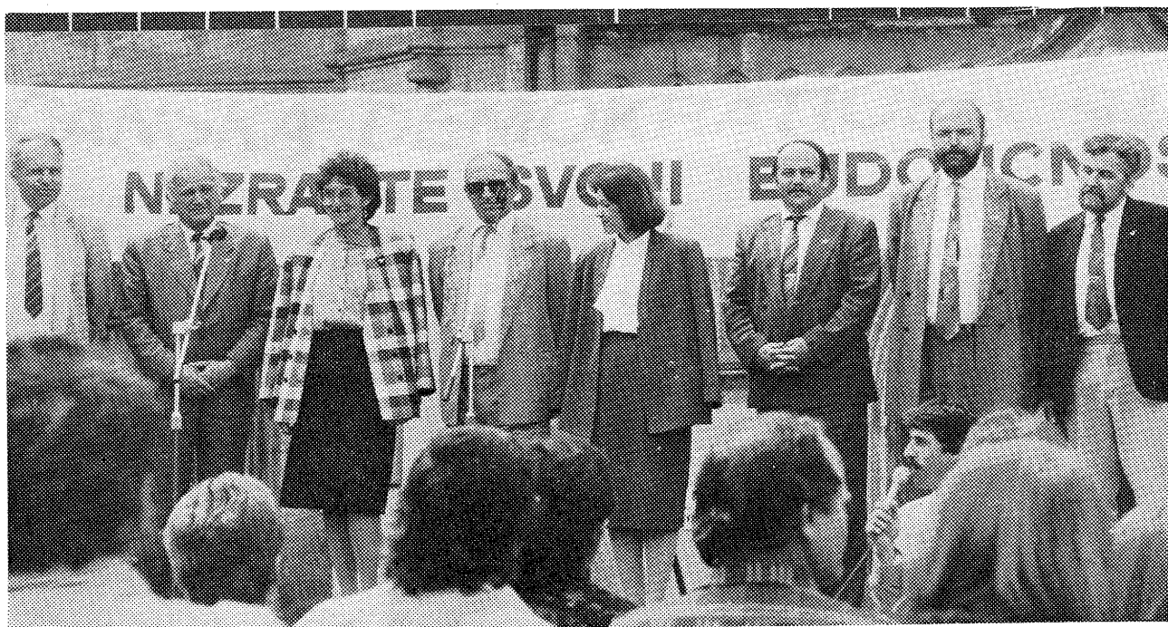
Na předvolebním shromáždění koalice ODS a KDS v našem městě se v odpoledních hodinách 30. května představili všichni významní kandidáti v našem volebním kraji - čtvrtý zleva je PhDr. Jan Stráský, první kandidát pro volby do České národní rady a místopředseda vlády ČR, po volbách předseda vlády ČSFR