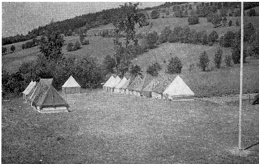
Sokolský tábor na Studenově v roce 1946

Ihned se začalo budování tábora, aby mohl I. běh tábora již 1. července zahájit. Velké pracovní úsilí bylo korunováno úspěchem, i vyjednávání s hygienou bylo zvládnuto, a tak nastala nová éra tábora Plátěné osady.