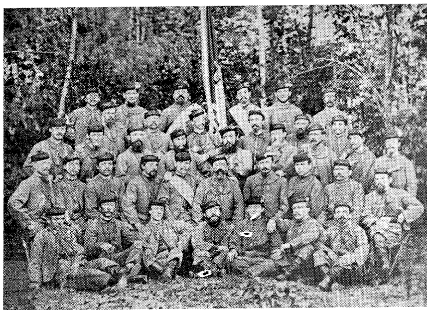
Členové novobydžovského Sokola s praporem - snímek asi z roku 1884

STRĀDĀNÍ ŽIDOVSKÉHO OBYVATELSTVA. V roce 1536 vydal Vilém z Pernštejna nařízení o židech, které ukazuje, v jak neplnoprávném postavení tato část obyvatelstva Nového Bydžova žila. Pod pokoutou deseti míšeňských kop žádný žil neměl či v domě mít či přechovávat ani podruha, ani zete, a pokud u něj byl, musel do čtyř neděl odejít. Jestliže by žid ve městě oženil syna či vdal dceru, musel je do dvou neděl vystěhovat. Bez vědomí úřadu u sebe židé nesměli žádnou osobu přechovávat déle než tři dny. Pokud chtěl některý žid prodat svůj dům, mohl ho prodat jedině křesťanu. Podobně i při úmrtí žida bez potomků nemohl být dům