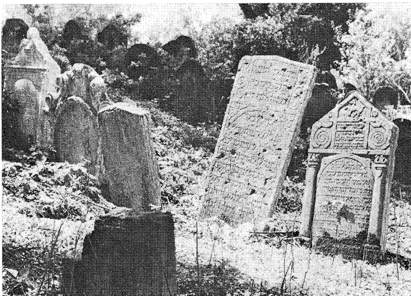
Partie z upravovaného starého židovského hřbitova, založeného už v roce 1520

ODVÁŽNÝ ŘEČNÍK. V rámci sjezdu Krakonoše, spolku akademiků severovýchodních Čech, vystoupil 28. srpna 1887 na novobydžovském náměstí s projevem mladočeský zemský poslanec JUDr. J. Herold. Za bouřlivého souhlasu přítomných tu zazněla