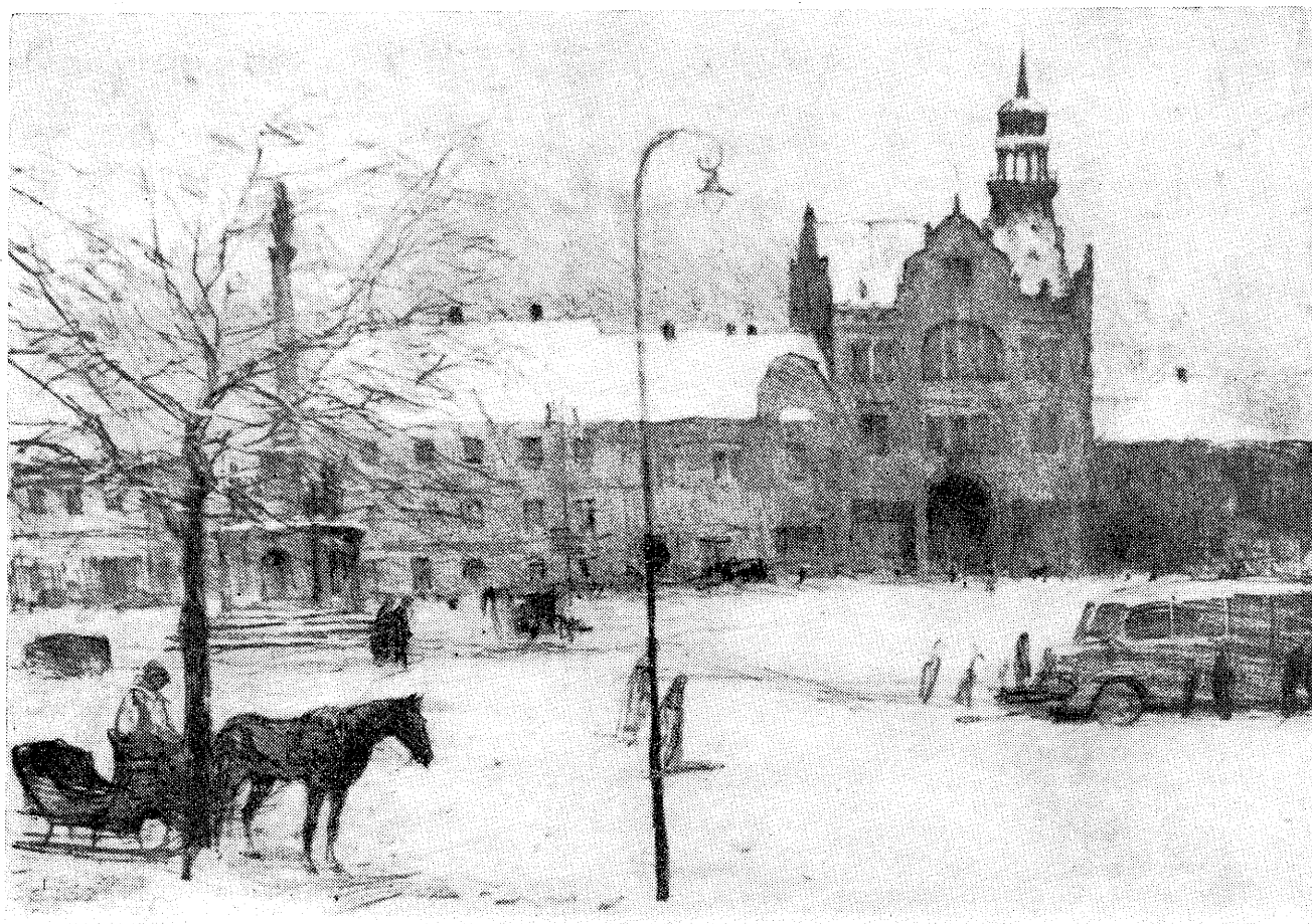
St. Hudeček: Náměstí v zimě