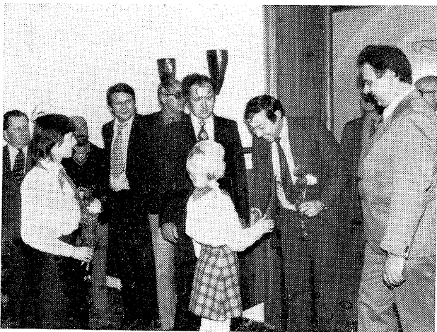
Bulharská delegace na radnici