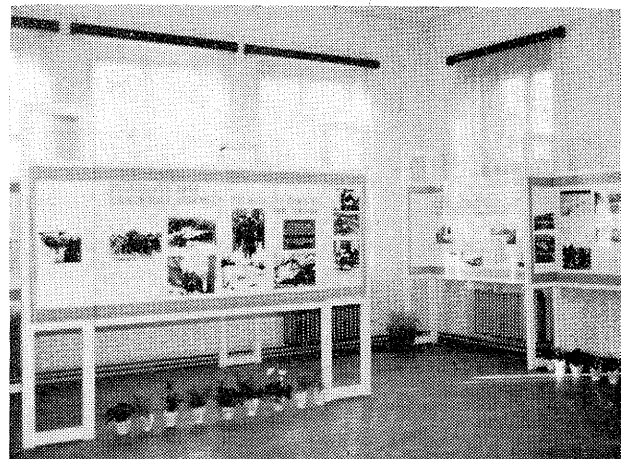
První návštěvníci výstavy