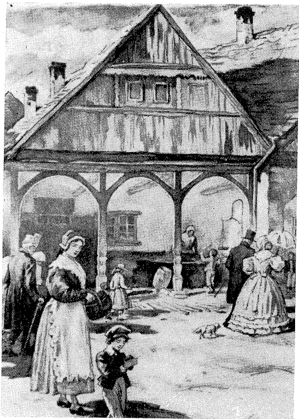
St. Hudeček — Obraz minulosti Náměstí o jarmarku