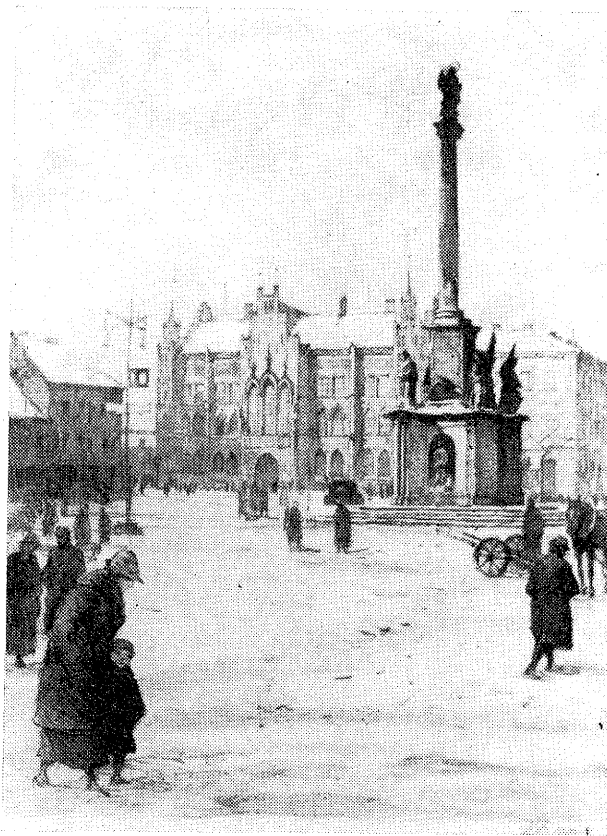
Náměstí s radnicí