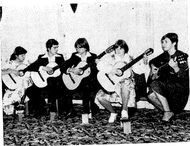
Vystoupení žáků LŠU