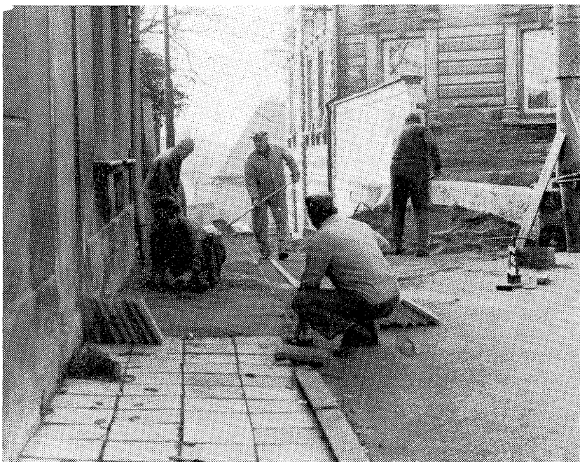
Brigádníci OV č. 5