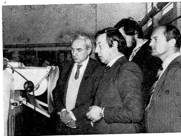
V PMV Nový Bydžov