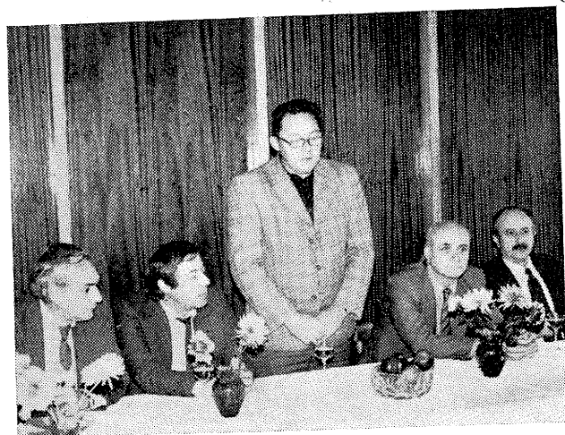
Beseda v JZD ČSSP