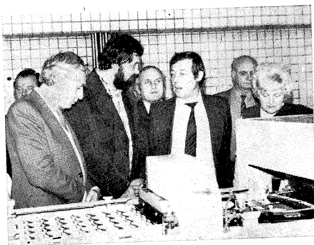
Prohlídka provozu PMV